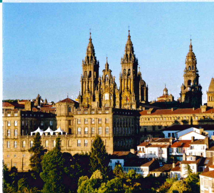
Santiago de Compostela

Per annullamenti, penalità, recessi, valgono le condizioni generali riportate dall'operatore.